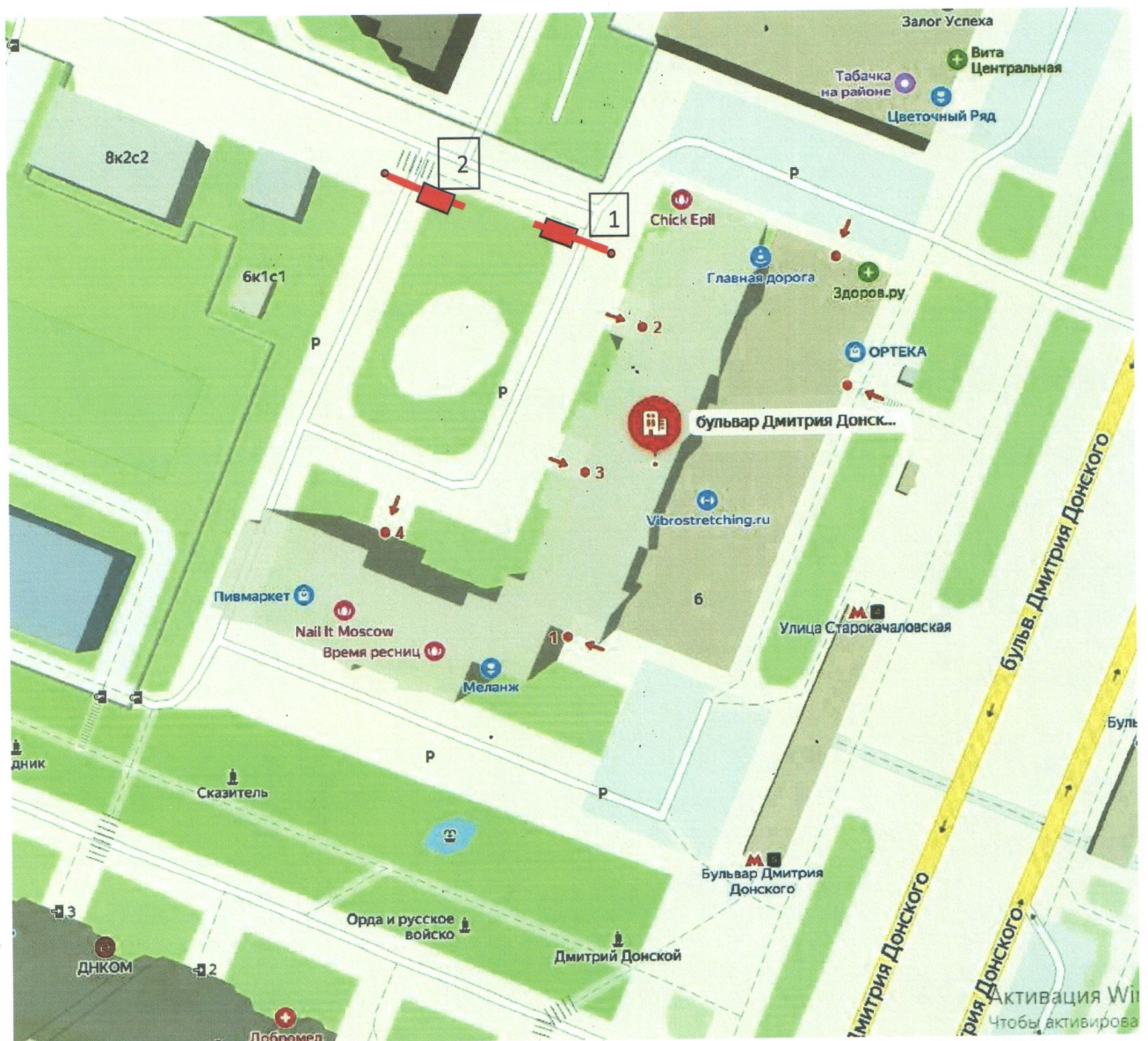
Схема размещения шлагбаумов:

1. Место размещения шлагбаумов: г. Москва, бульвар Дмитрия Донского, д. 6, при въезде на придомовую территорию.